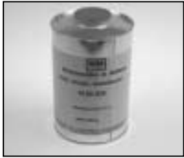
L4.70186.E Paint thinner Farb-Verdünnung