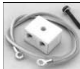
L4.83232.E Terminal block and earth cable Kabelklemme und Erdungskabel