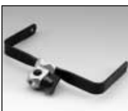
L4.83226.E Stirrup complete Haltebügel komplett