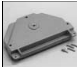
L4.83223.E Side casting Seitenteil