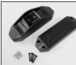
L4.77157.E Inline switch complete 110 – 240 V Schnurschalter komplett