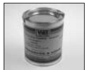
L4.70189.E Paint silver metallic similar RAL 9011 Lack silber metallic ähnlich RAL 9011