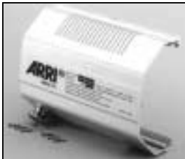
L4.83221.E Reflector housing Cyc Reflektorgehäuse Cyc

NOTE: WHEN ORDERING QUOTE PART NUMBER BEMERKUNG: BEI BESTELLUNG IDENT.-NR. ANGEBEN