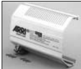
L4.83222.E Reflector housing Flood Reflektorgehäuse Flood