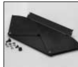
L4.83230.E Barndoor, cpl. Flügel, kpl.