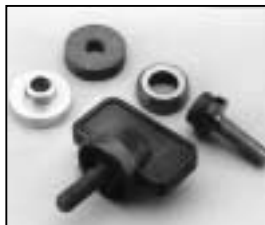
L4.83228.E Stirrup mounting set Bügelbefestigungs-Set