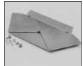
L4.83230SE Barndoor, cpl. silver Flügel, kpl. silber