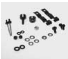
L4.82017.E Mounting set for 1 barndoor Befestigungsset für 1 Flügel