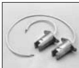
L4.83231.E Lampholder Lampenfassung