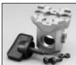
L4.77145.E 16 mm stirrup socket Hülse für Bügel