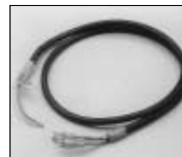
L4.83233.E Head to switch cable 100–240 V Zuleitung 100–240 V