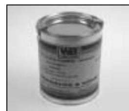
L4.70183.E Paint black similar RAL 9011 Lack schwarz ähnlich RAL 9011