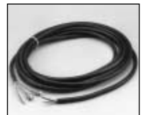
L4.83234.E Mains cable 100–240 V Netzkabel 100–240 V