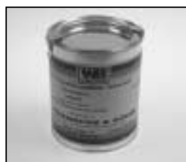
L4.70194.E Paint blue similar RAL 5015 Lack blau ähnlich RAL 5015