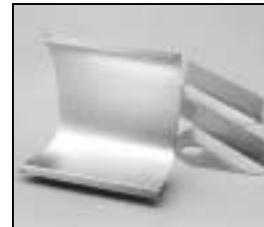
L4.83224.E Reflector, compl. Cyc Reflektor, kpl. Cyc