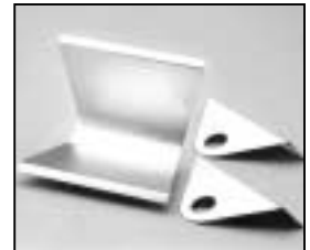
L4.83225.E Reflector, compl. Flood Reflektor, kpl. Flood